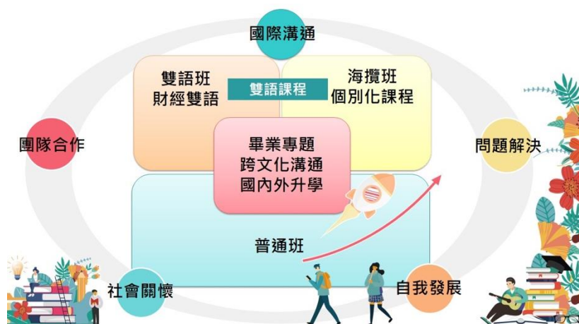
圖：本校課程與海外子女攬才班課程關係圖

本課程地圖，利用本校海外攬才子女專班的師資與教材資源，與海攬班的學生特殊的文化背景結構結合，並且透過校訂必修、團體活動時間與普通班的學生進行形式與非形式的交流，達到陽明學生與海攬學生雙贏的績效。